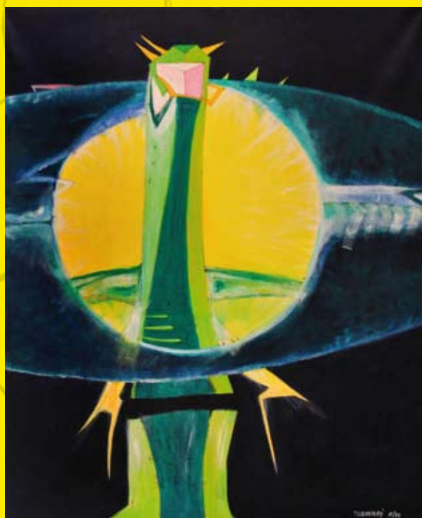
Pf: Otciv zmatek

Stvorili ste monštrum Rátajte s dôsledkami