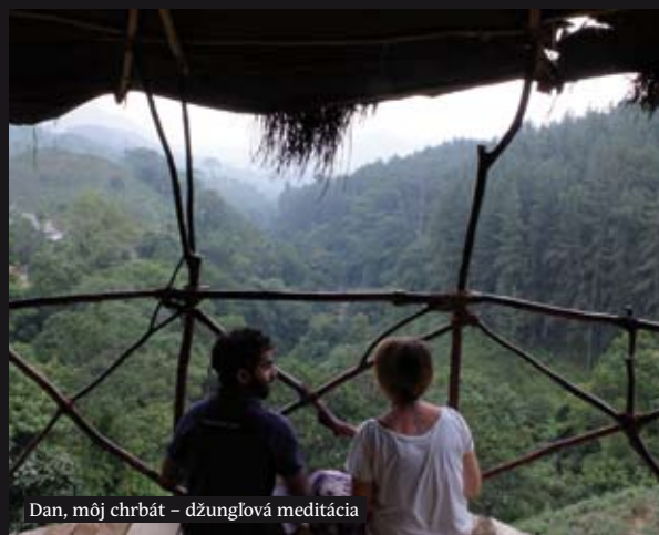
Dan, môj chrbát - džungľová meditácia

deň narodeniny. Otec. Opäť, pamätám si tento deň ako včera. Plus, dážd' po šiestich mesiacoch sucha. Trojitý úder. Zdá sa mi, že ľudia to nazývajú pozhnaním. Viva la vida. Želám veľa takýchto dní!