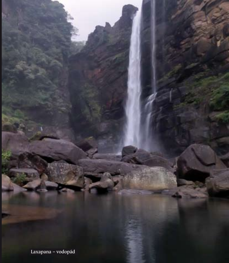
Laxapana – vodopád