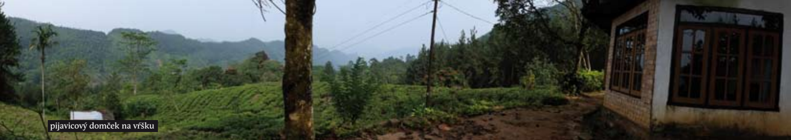
pijavicový domček na vršku